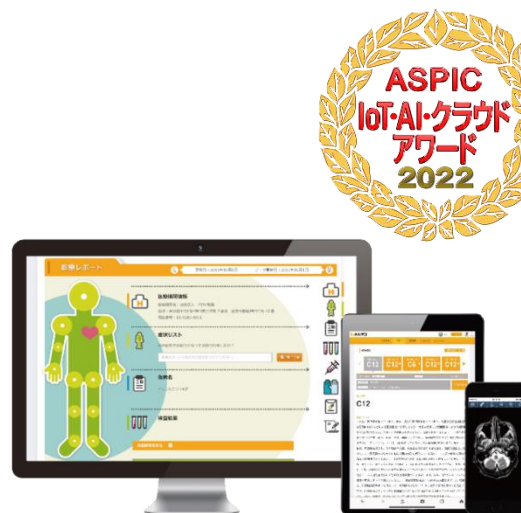
【カルテコの画面イメージ】