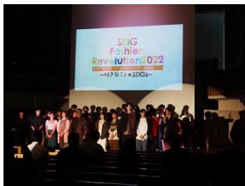
古着ファッションショー