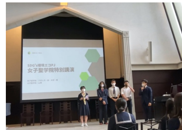
環境エコプロジェクトの活動