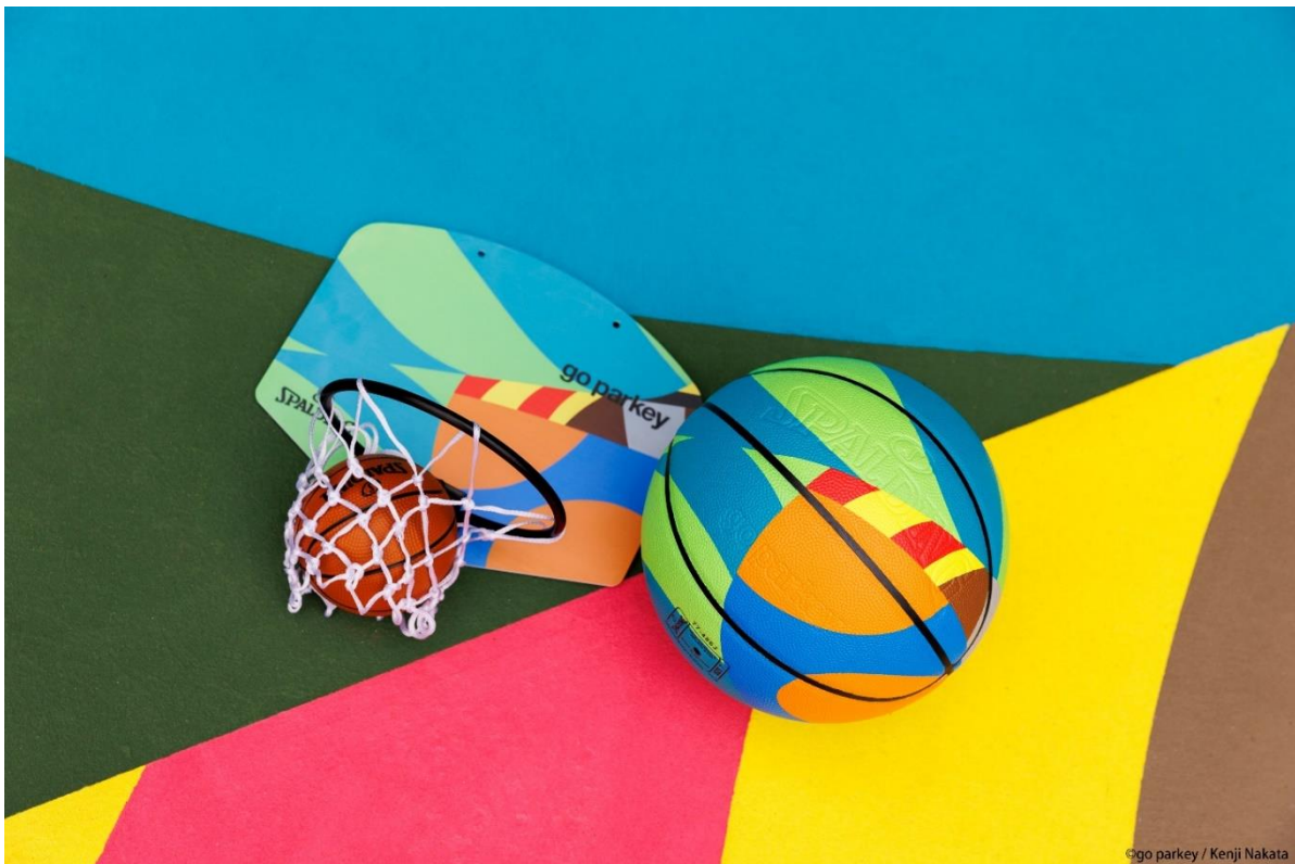
写真右：7 号球バスケットボール『GO PARKEY MULTI COLOR』

スポルディング・ジャパン株式会社（本社:東京都渋谷区、代表：小笠原俊彦 以下スポルディング）は、公園のバスケットコートのリノベーション活動を通じてスポーツ文化の普及を目指す団体 go parkey (ゴー パーキー)の日本第 1 号プロジェクトである『浜町公園リノベーション・アートコート』の-artをバスケットアイテムにそのまま落とし込んだ、バスケットボール『GO PARKEY MULTI COLOR(ゴーパーキー・マルチカラー)』とミニゴール『MICRO MINI GO PARKEY(マイクロミニ・ゴーパーキー)』を、2022 年 12 月 9 日(金)に発売いたします。本アイテムは、スポルディング公式オンラインショップをはじめ、全国の取り扱い店舗にて販売され、地球環境への負荷軽減を目指した取り組み『PASS FOR THE FUTURE』の一環として、売上の一部が go parkey に寄付され、今後の活動資金となります。