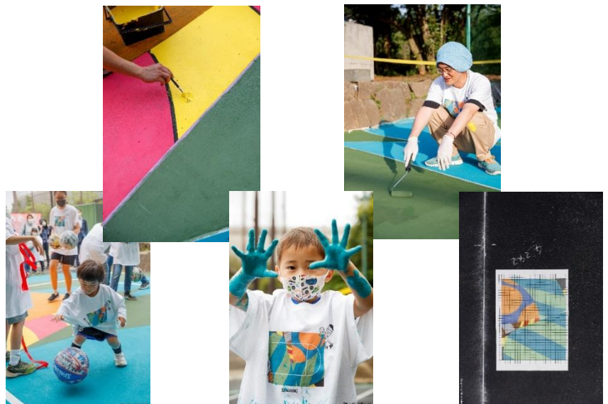
写真右：go parkey 代表理事 海老原奨氏