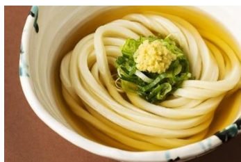
▲伊吹うどん かけうどん