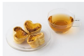
▲粥茶館 糖朝 エッグタルト(1個)・マンゴフルーツティ

※カフェ&グルメチケットご利用時は、「もつ鍋」と「かけうどん」はテイクアウトでのお渡しとなります。