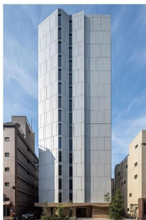
ライオンズフォーシア浅草橋 (2022年3月竣工)

「ライオンズフォーシア」は、2007年より展開する、分譲マンションの開発で培ったノウハウを活用した大京の賃貸マンションブランドです。これまで東京・神奈川・大阪・広島で24棟の開発実績（本物件含む）があり、各地の都心で働く20代～40代のシングルや共働きのご夫婦、小さなお子さまのいるご家族を中心にご入居いただいています。外観デザインはホテルや商業施設のトレンドを取り入れながら一棟一棟のデザインにこだわり、間取りは都心の賃貸居住者の生活ニーズに対応した多彩なプランを企画しています。