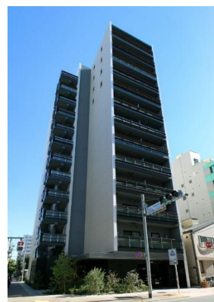
ライオンズフォーシア入谷イースト (2022年10月竣工)