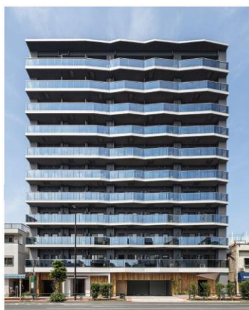
ライオンズフォーシア隅田川テラス (2022年4月竣工)