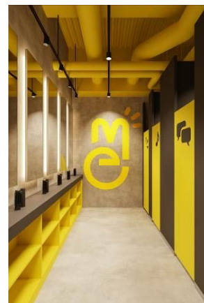
男性お手洗いロッサ―（イメージ）