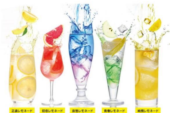
提供ドリンク（イメージ）

3階にあるカフェフロアでは、ドリンク全12種類をオール400円(税込)にて提供いたします。ME TOKYO SHINJUKUのコンセプトをイメージしたレモネードを中心に、新宿の喧騒の中でちょっと微笑んでもらえるメニューを準備いたしました。また、Z世代を意識して男女どちらのお手洗いにもロッサ―を設置しています。人々の出発地点でもある新宿で、お出かけ前に男性・女性が十分に身だしなみを整えられるスペースです。