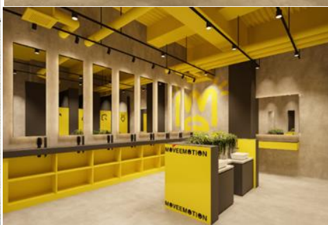
店内イメージ（トイレドレッサー）