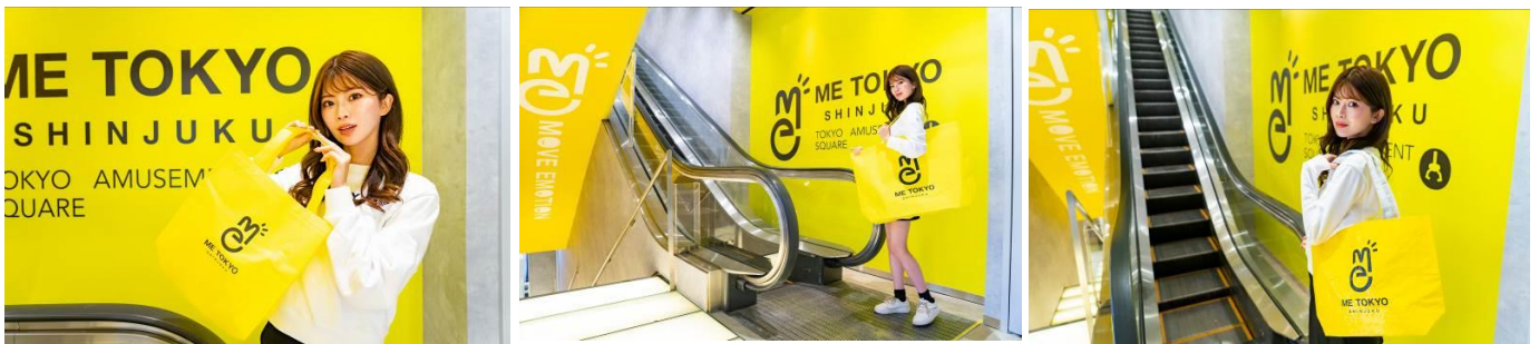
(左・小サイズ/中・大サイズ) プライズお持ち帰り用オリジナル無料バッグ (右) 数量限定・開業記念LINE登録キャンペーン配布バッグ

Twitter: https://mobile.twitter.com/ririlx )