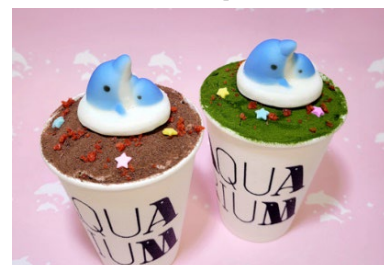
販売中のホットドリンク 「キアとベイビーのあったかココア」 「キアとベイビーのあったか抹茶ラテ」 各680円（税込）

* グランピングドームは定員4名、スペシャルシートは定員8名（2名×4シート）です。