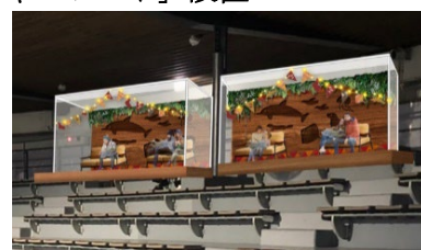
「スペシャルシート」（イメージ）