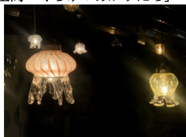
「クラゲランプ」（イメージ）

「クラゲワンダー」で飼育する約30種 * のクラゲの中から、20種のクラゲが暖かい光を放つランプシェードとなって「交流プラザ」の天井を彩ります。新潟のガラス専門店「TAKU GLASS」の職人技と、大きさ、色、形など種類ごとに特徴が異なるクラゲの魅力を伝えたいという飼育スタッフの思いが融合し、京都水族館ならではのガラスの空間に仕上がりました。