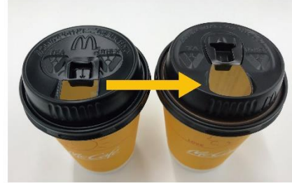
飲み口のサイズ 18.7mm×14.6mm → 22mm×24mm

お客様にさらにご満足いただくために、香りにもこだわります。従来よりもカップ蓋の飲み口を広げることで、よりコーヒーのアロマをお楽しみいただけるようリニューアルしました。