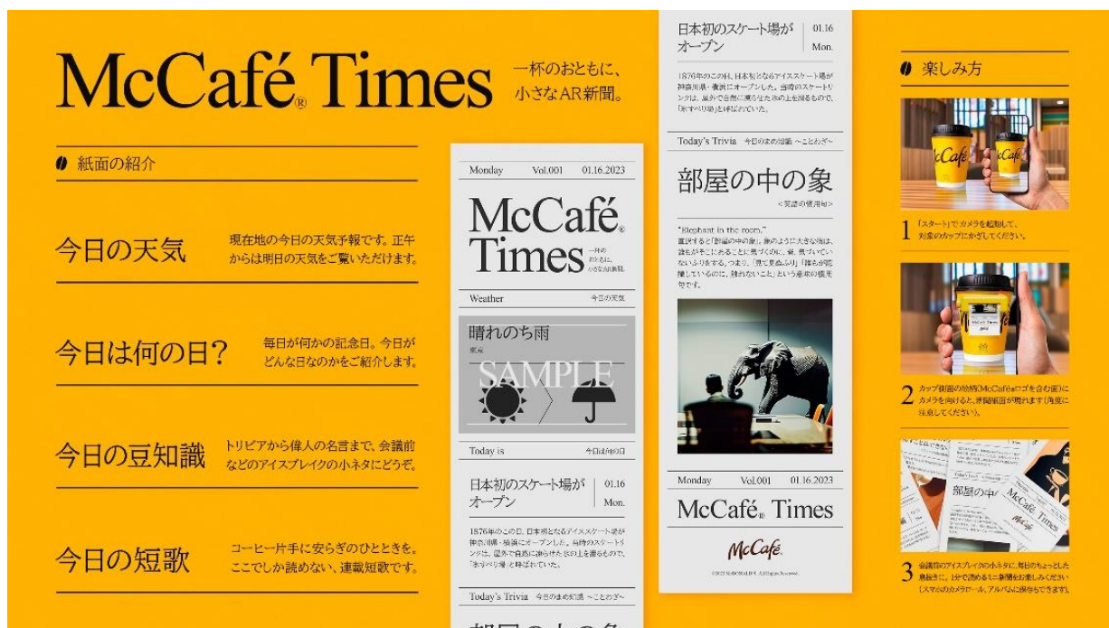
『McCafé Times』のコンテンツイメージ