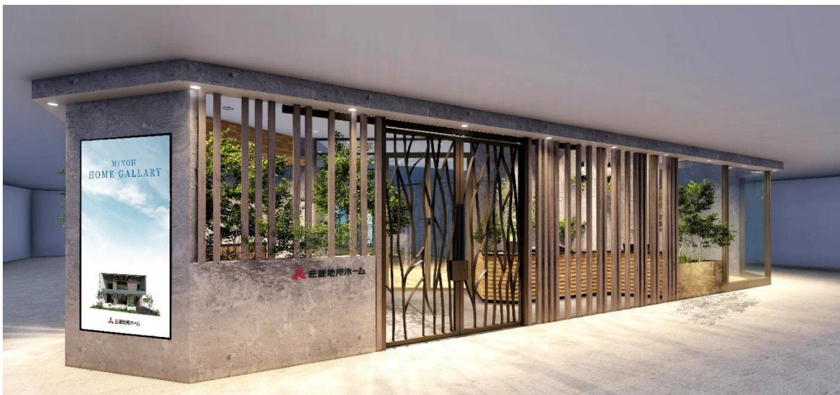
エントランス部分のパース。樹木のデザインの門扉が縦ルーバーと重なり、森の中のような雰囲気。

木に触れた感覚、生い茂る緑の香り、頬にあたる澄んだ空気、微かに聞こえる水音。そうした自然との対話が、家づくりのきっかけになるように、山から海を緩やかに繋ぐ自然溢れる芦屋の地から、木とともに過ごす豊かな暮らしを発信し、この場を通じて注文住宅、オーダーメイドリフォーム、全館空調「エアロテック」の価値を提供します。