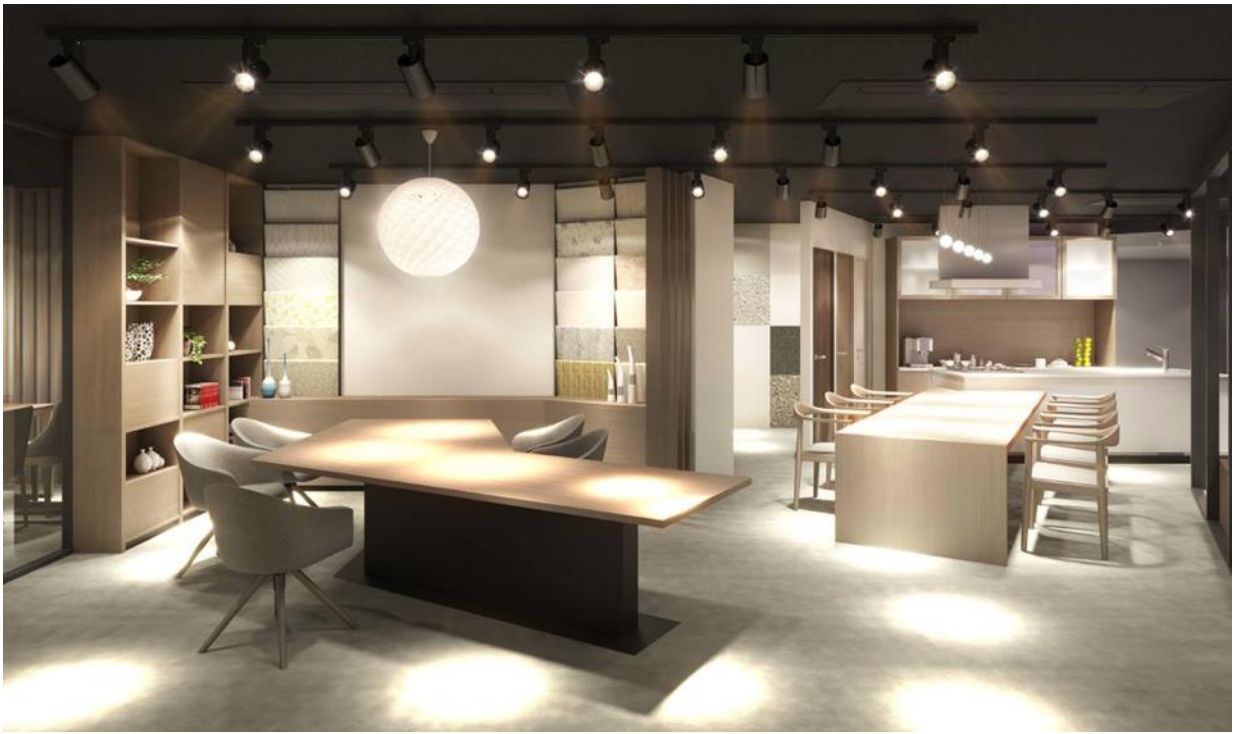
ショールームエリアのイメージパース