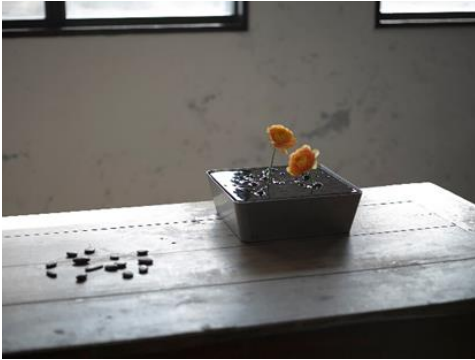
ファウンテンベース

受付カウンターに国産杉の樹皮を、天井にグループ会社 MEC Industry の国産杉 CLT の端材を仕上材に使うショップエリアでは、青山フラワーマーケットの姉妹ブランド「parkERs（パークーズ）」とともに考えた、家具を販売しています。ここでは、何かとストレスに満ちている現代社会の中で、植物（グリーン）の持つ自然の力を暮らしに取り込み、心身ともにリラックスできる健康的で豊かなライフスタイルを実現する当社独自の提案として、建築とグリーンを一体で考える新しい空間デザイン「ボタニカル リラクゼーション」を紹介しています。