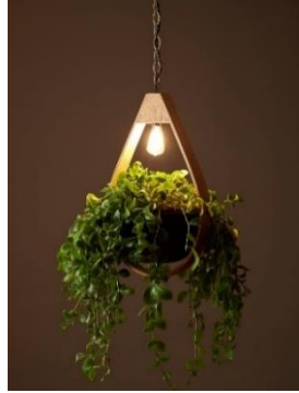
フォレストランプ