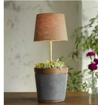
ボタニカルランプ