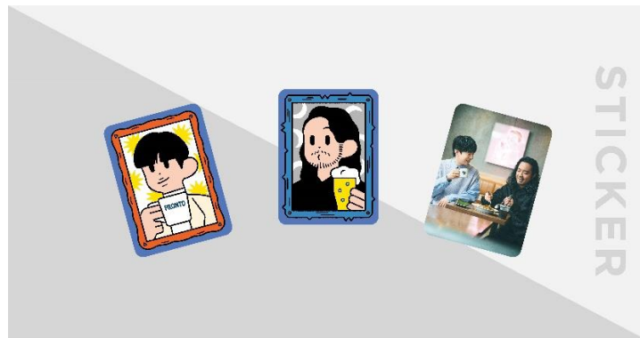
コラボドリンク購入特典「オリジナルステッカー」全3種

さらに、コラボドリンクをご注文の方には「オリジナルステッカー特典（全3種）」を、コラボパスタをご注文の方には「オリジナルポストカード特典（全3種）」を1注文につき1つ、ランダムでプレゼントいたします。