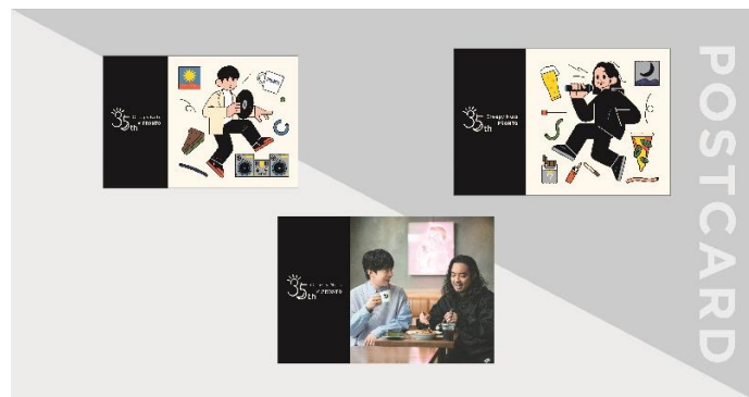
コラボパスタ購入特典「オリジナルポストカード」全3種

加えて、パーカー、Tシャツ、サーモステンレスボトル、サーモマグ、エコバックなどのCreepy Nuts × PRONTO（プロント）コラボのオリジナルグッズの数々も販売いたします。