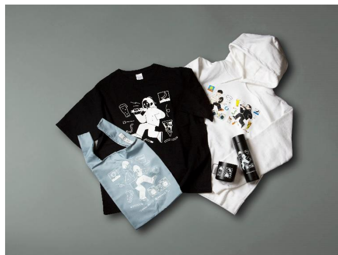
Creepy Nuts × PRONTO（プロント）オリジナルコラボグッズ

加えて、パーカー、Tシャツ、サーモステンレスボトル、サーモマグ、エコバックなどのCreepy Nuts × PRONTO（プロント）コラボのオリジナルグッズの数々も販売いたします。