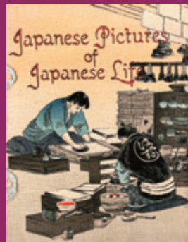
『日本の人々の生活』 1903年発行