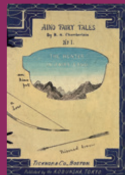
『アイヌ民話集』 1887年発行