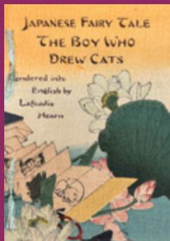
『猫の絵を描いた 小僧』1898年発行