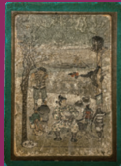
平紙本『日本昔噺集』 1885~1892年発行