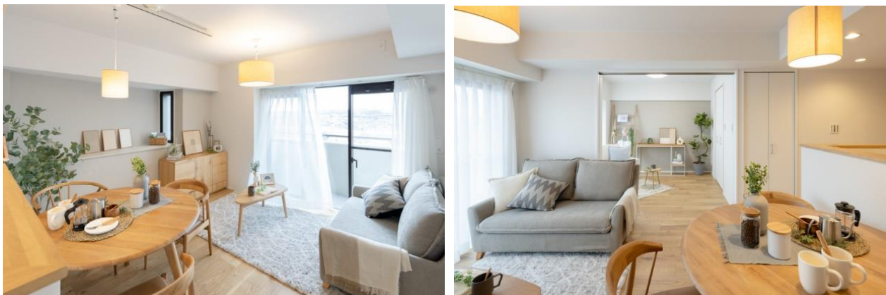
リビング・ダイニングの照明にコーヒー染めのペンダント照明を採用