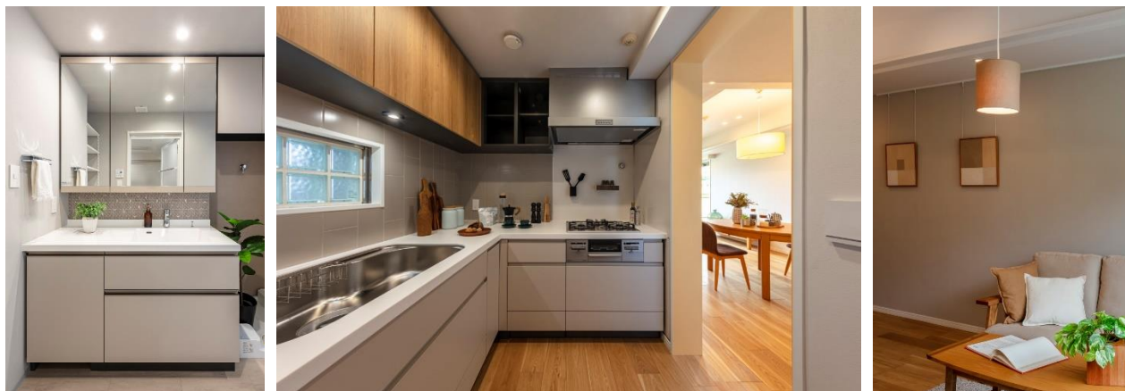
洗面台の鏡の下に廃材利用のタイルを使用／キッチン壁面に再生材利用のタイルを使用／コーヒー染めのペンダント照明