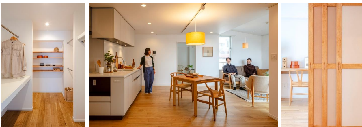
間伐材を使用した収納棚／コーヒー染めのペンダント照明／コーヒー染めの布框戸

➤ 2つの洋室とリビング・ダイニングの間の布框戸とリビングおよびダイニングの照明には、Hyleが製作したコーヒー染めの張地を採用