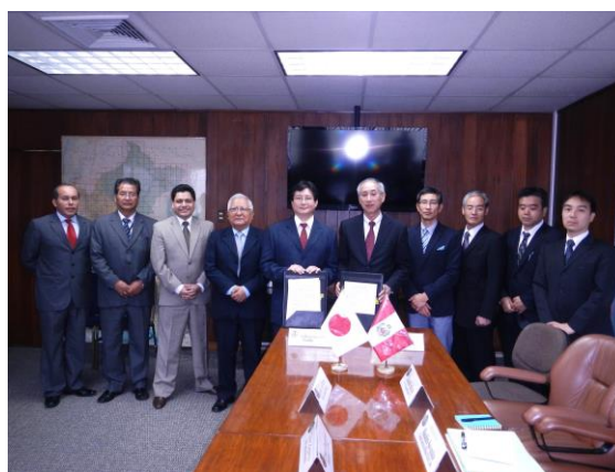
署名後の記念撮影

今回の鉱害防止政策アドバイザー派遣の延長は、JOGMEC がこれまで同国で取り組んできた鉱害防止支援事業を高く評価したMEMからの強い要望によって実施されるものです。本協力によって、同国における鉱害環境問題等を背景とする地域住民争議の解決や、同国との関係強化による日本への鉱物資源の安定供給にも寄与するものと期待されます。