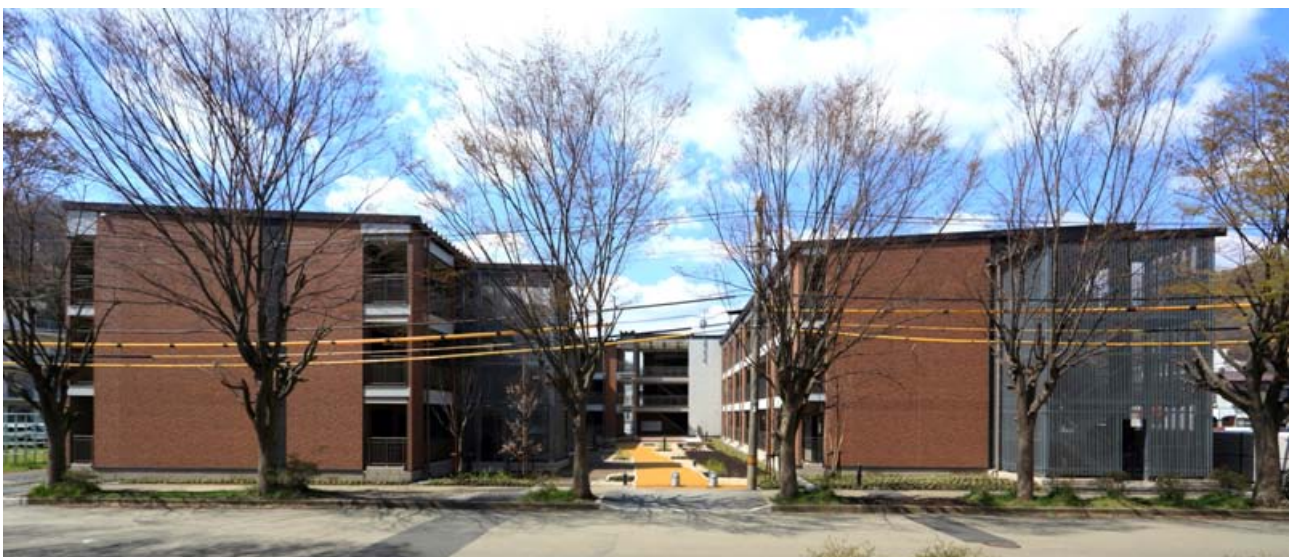
[参考]第Ⅰ期(1号棟)竣工写真