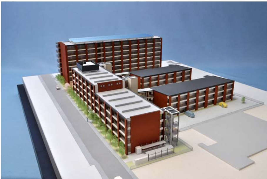
第Ⅱ期 完成予想模型