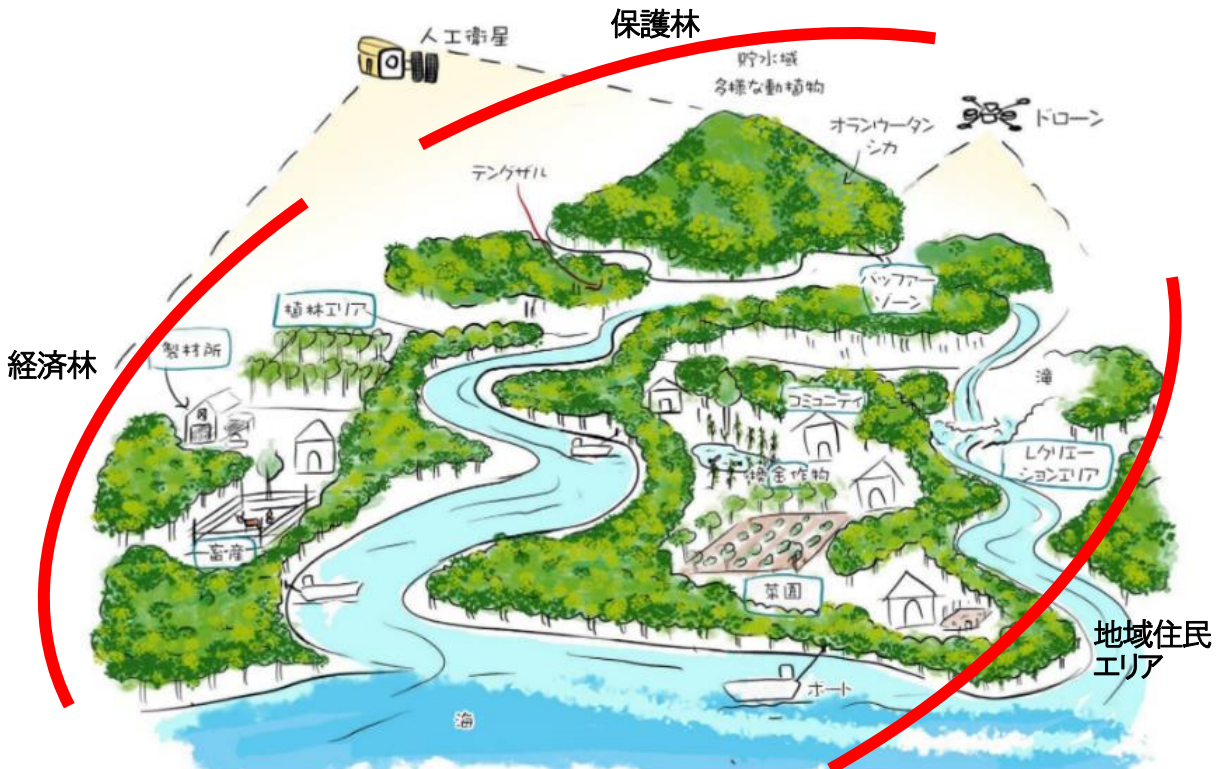
＜プロジェクトイメージ＞NeXT FOREST 社が普及する熱帯泥炭地の持続的 management 「経済林」「保護林」「地域住民エリア」に分けて経済性と社会環境を両立