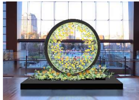
▲イメージ「夢の向こう側」(ガレリア1F Bonpoint 前)