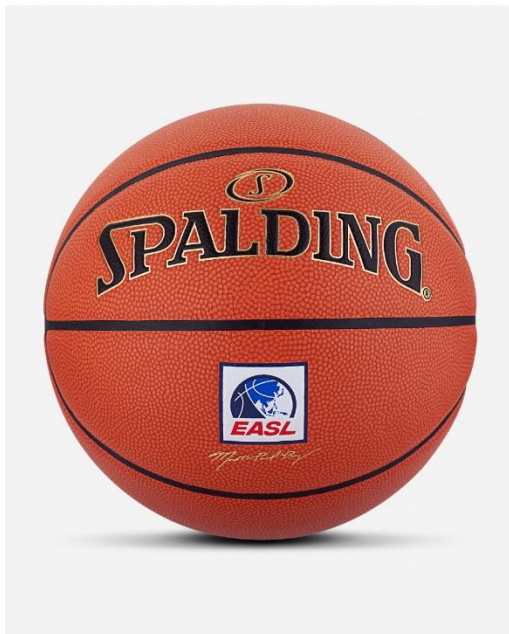
FRONT : EASL ロゴ刻印

EASL の試合では、EASL ロゴが刻印された限定モデルのレガシーTF1000 が使用されます。