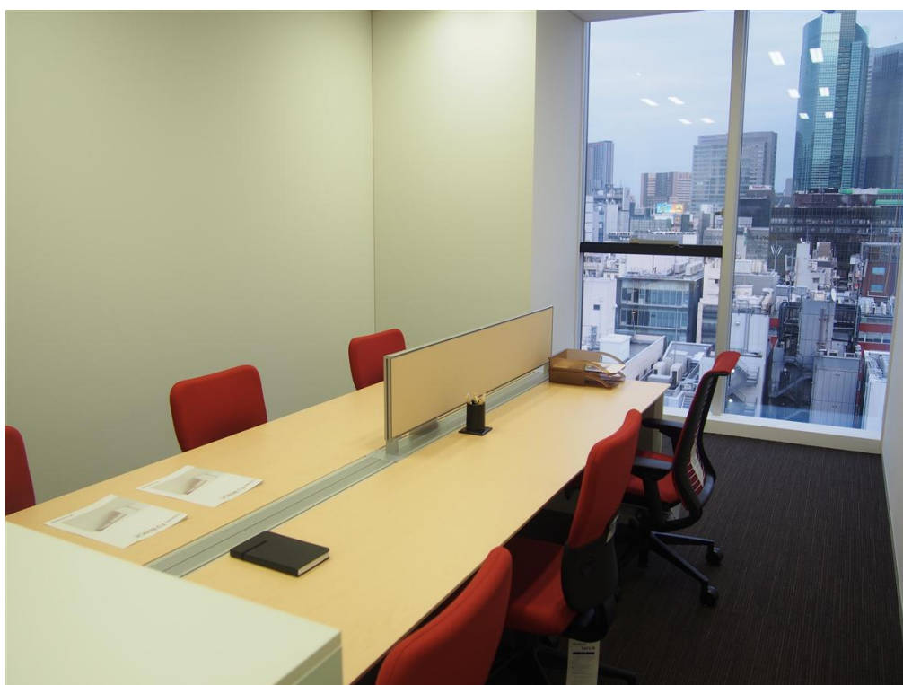
1407 号室(25.94 m 2 )