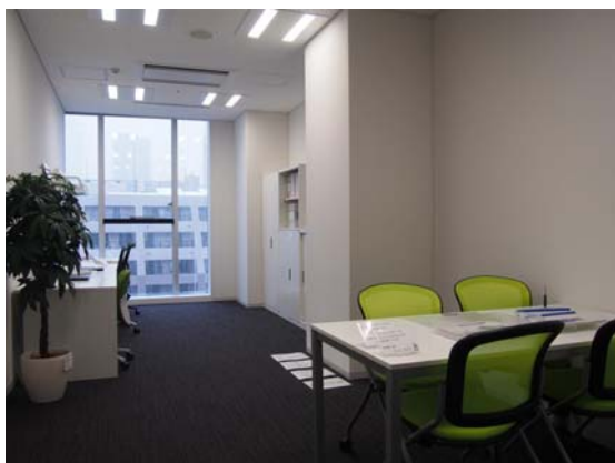
1001 号室(27.39 m 2 )