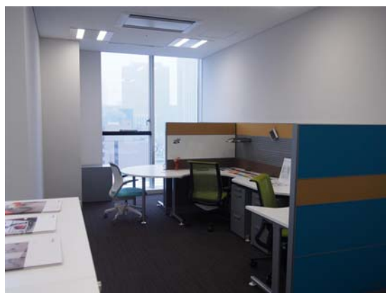
1403 号室(42.64 m 2 )