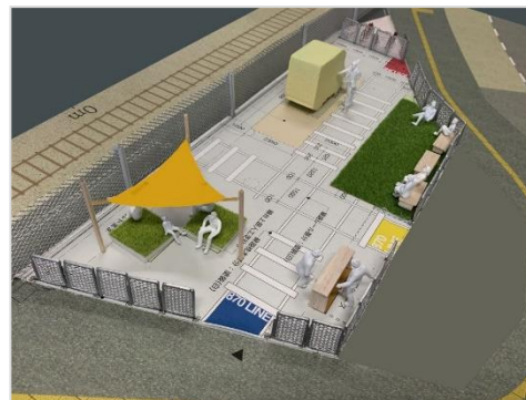
「Park Line 870」イメージ