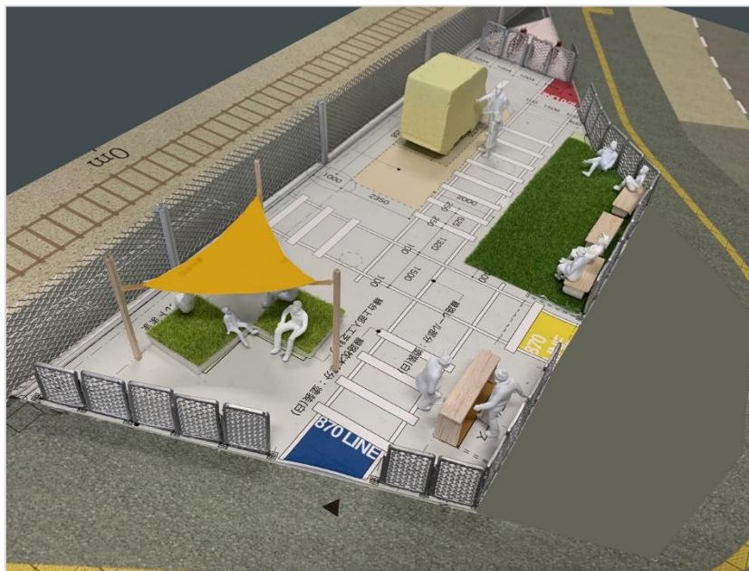
「Park Line 870」イメージ