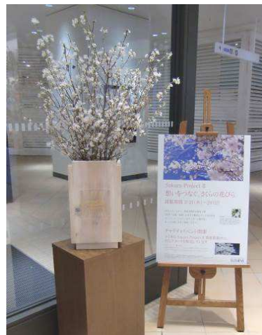
< 今年の展示の様子 >