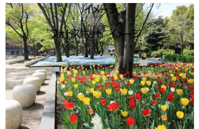
過去のネモフィラ・チューリップ花壇の様子