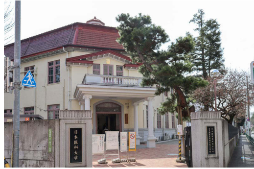
▲ワイルドライフ・ミュージアムは国の登録有形文化財(建造物)に指定された一号棟の中にある