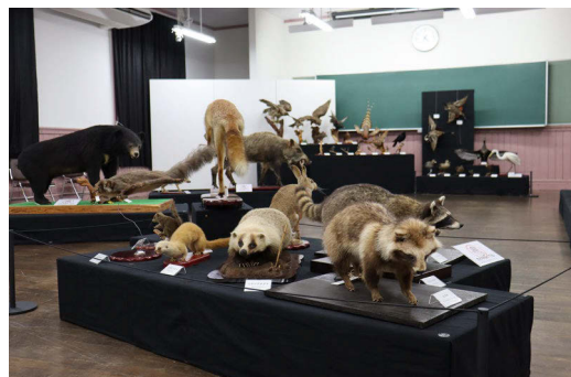
▲自然系展示室の剥製の一部