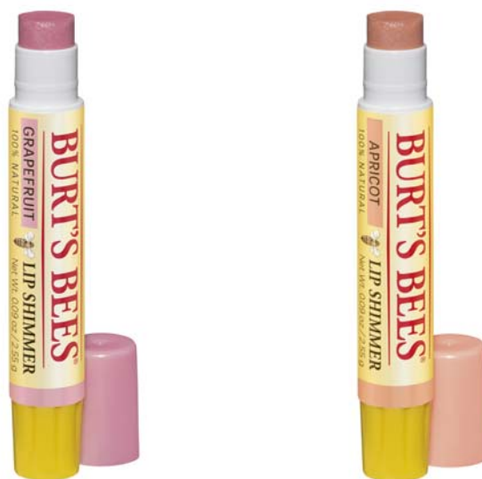
BURT'S BEES「リップシマー」 左から「グレープフルーツ」、「アプリコット」 (¥800・税抜 / ¥864・税込)

“地球に優しく、人に優しい”を信条とするアメリカ生まれのナチュラル・パーソナルケアブランド BURT'S BEES(バーツビーズ)は、人気のリップカラーシリーズ「リップシマー」に春夏向けのパステルカラー2色を新発売いたします。