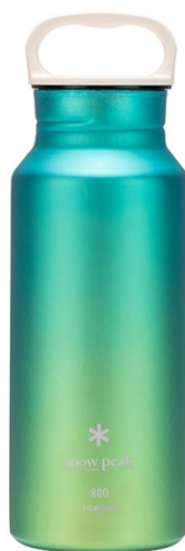
【オーロラボトル オーシャンの写真】

日本製鉄は、今後もスノーピークとの連携を深め、環境配慮型の取り組みを拡大させていきます。