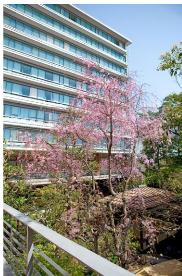
(左上)ホテル椿山荘東京 (左下)箱根ホテル小涌園 (右)京都国際ホテル