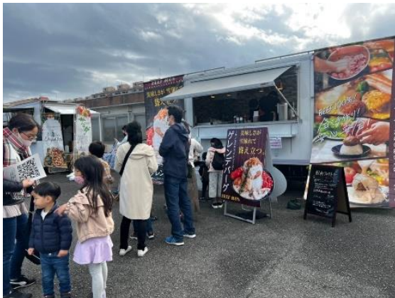
他地域での開催風景

京急電鉄は，今後も「おおたCOCOON」を通じ，地域と連携して大田区エリアの価値を高めていくとともに，変化の大きい時代における「新しいまちづくり」を進めてまいります。詳細は別紙の通りです。