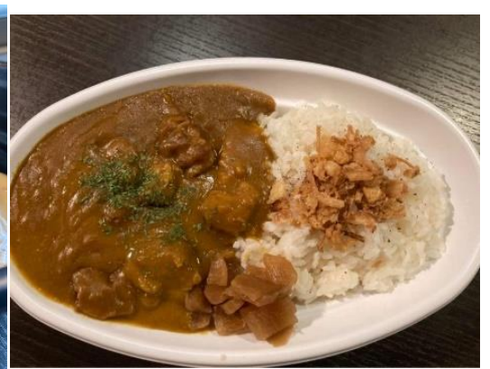
子ども・妊娠中の方に無料で提供するお食事 （左）ゲレンデバーグ （右）牛すじカレー