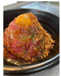
牛赤身のタワー丼(900円税込)