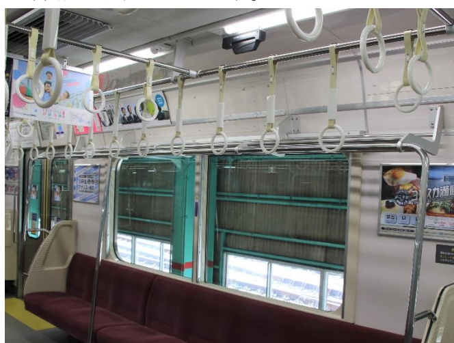
設置した車内のイメージ