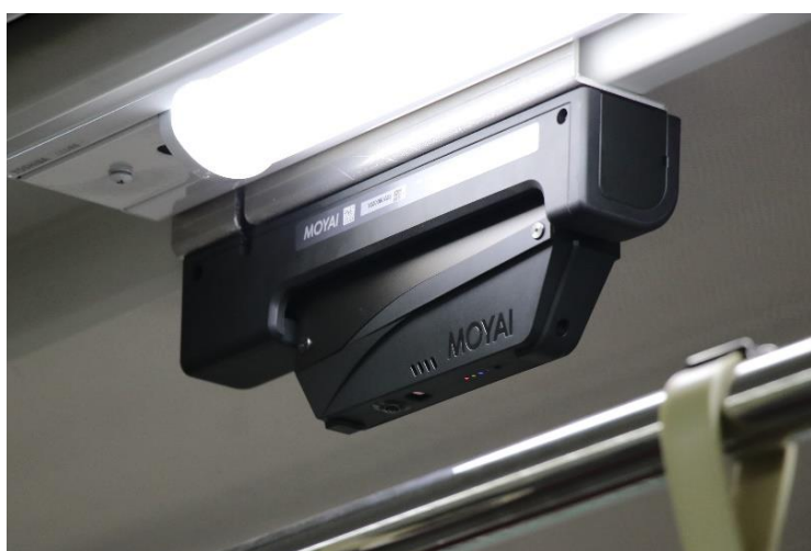
防犯カメライメージ