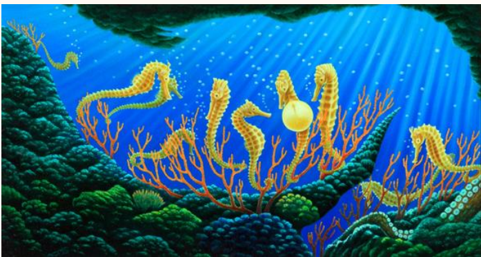
たつのおとしごの戯れ Frisking of Sea Horses 油彩 1993年 (30.5×56.0cm)