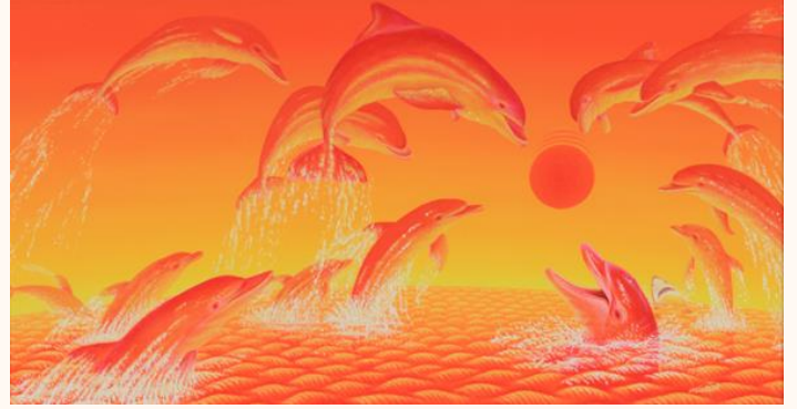
イルカの戯れ Playful Dolphins 油彩 1993年 (30.5×56.0cm)