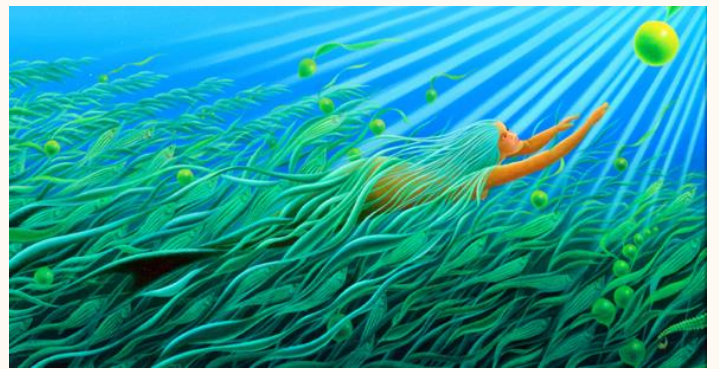
海草のマーメイド Seaweed Mermaid 油彩 1993年 (30.5×56.0cm)