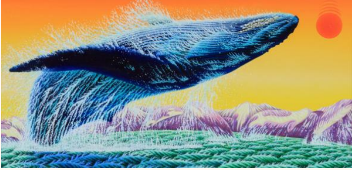
ザトウクジラの躍り Breaching Humpback Whale 油彩 1992年 (28.0×56.0cm)

展示17作品は、アメリカ、カナダで出版された絵本「Aska's Sea Creatures」Doubleday New York, Torontoの原画です。