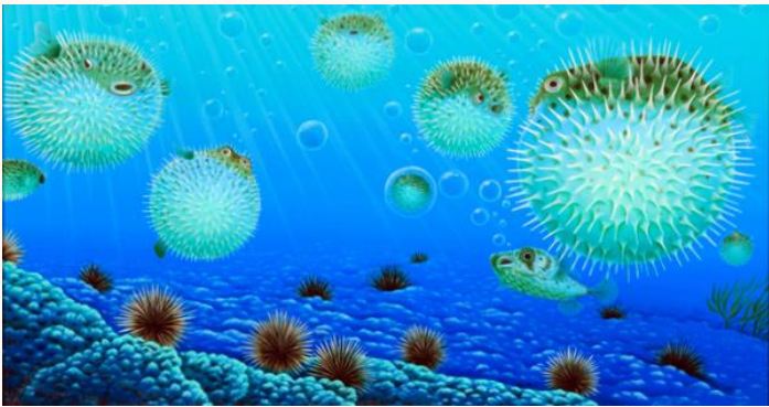
ぶくぶくのふぐ Puffing Puffer Fish 油彩 1993年 (30.5×56.0cm)