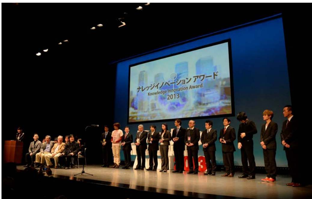
「Knowledge Innovation Award」授賞式の様子