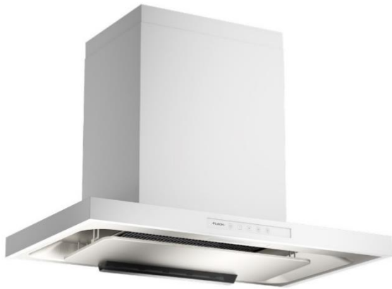
FR-ST2190 V TW