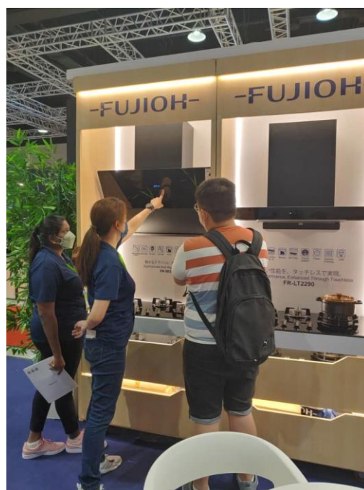
マレーシア「HOMEDEC」 FUJIOH ブースの様子

これまで FUJIOH は、HOMEDEC をはじめとしたマレーシアの展示会に継続的に出展することで、FUJIOHブランドとマレーシアのお客様の接点を作り上げてまいりました。今回の出展では、FUJIOH が日本市場で培った清掃性に関する技術を結集させたレンジフードや、使いやすさにこだわった新製品のコンロとオーブンを展示し、直接お客様に FUJIOH 製品の魅力をお伝えしました。また、ブースはブランドカラーであるジャパンプールを基調とし、障子や和風照明をあしらうことで FUJIOH が日本発のブランドであることを表しました。