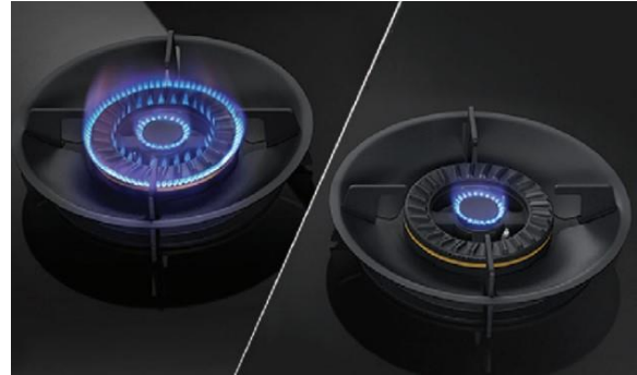
2つの円に分かれた炎で火力をコントロール