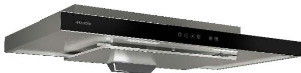
FR-MS1990 R/V GB