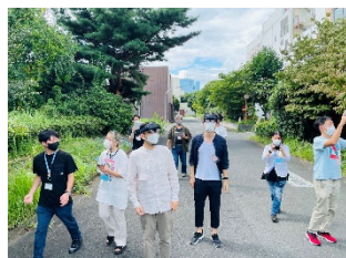
②Fieldwork AR (パカパカAR)