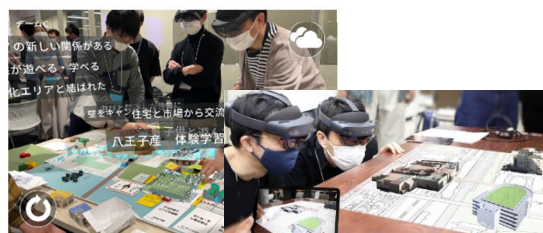
③Workshop AR (ポコポコAR)