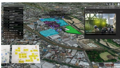
①torinome (トライノーム) デジタルツインWeb基盤システム (旧HoloMaps)