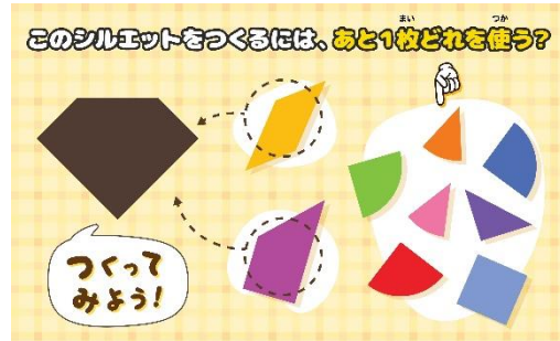
「ププッとかいけつ おしりたんていタングラムパズル」で体験できる遊び方のイメージです