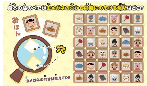
「おしりたんてい ププッとそうさくゲーム」で体験できる遊び方のイメージです