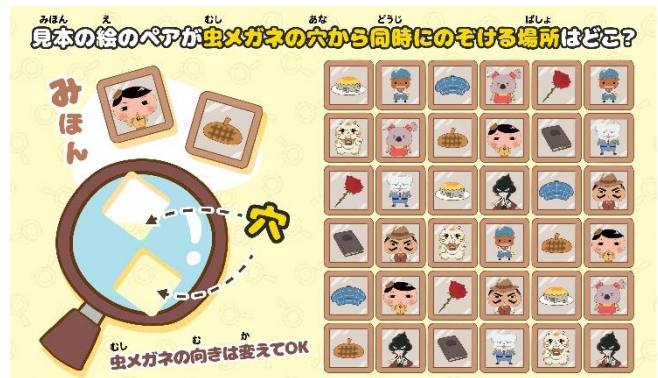
「おしりたんてい ププッとそうさくゲーム」で体験できる遊び方のイメージです ©トロール・ボプラ社/おしりたんてい製作委員会