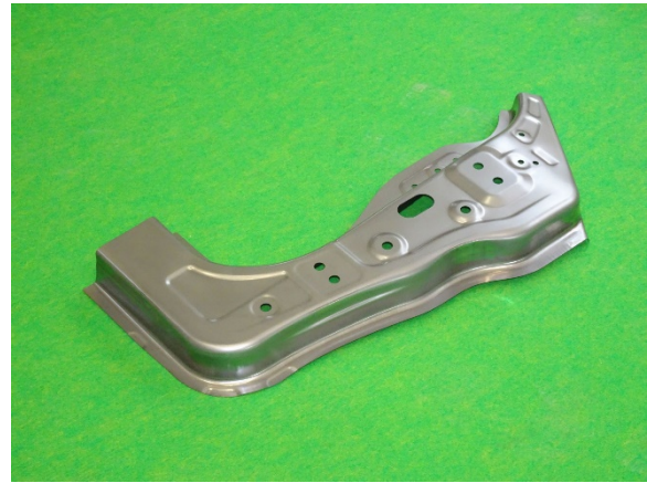
フロンピラー (1470MPa 材)