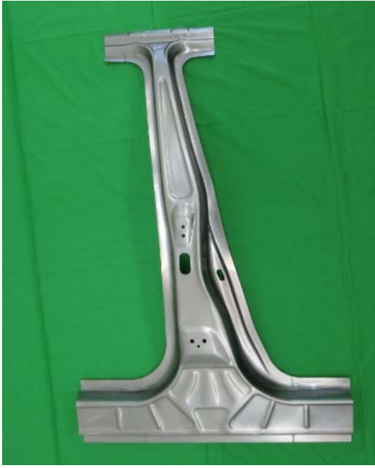
センターピラー (1470MPa 材)