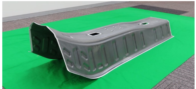
トンネルリフォース (1180MPa 材)