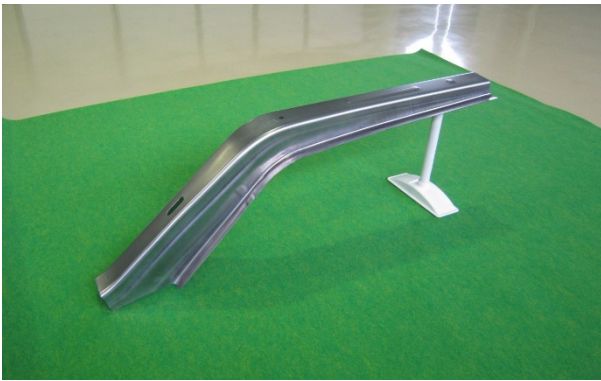
サイドメンバーリア (1470MPa 材)