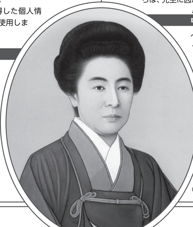
原田芳洲画「下田歌子先生肖像」 (岐阜県恵那市蔵)