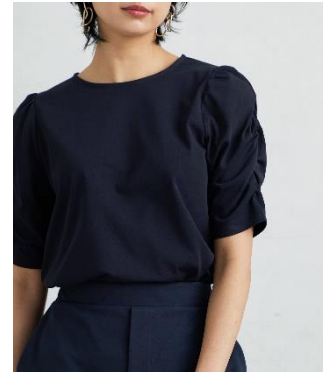
シャーリングトップス ¥3,960(税込)