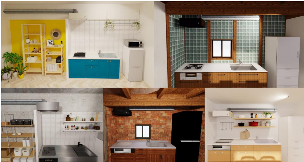
5種類のインテリアイメージ

※1 富士工業グループは、一般家庭用レンジフード供給台数国内シェアNo.1。(2021年4月東京商工リサーチ調べ ODM生産品を含む) FUJIOHは、富士工業グループの企業ブランドです。