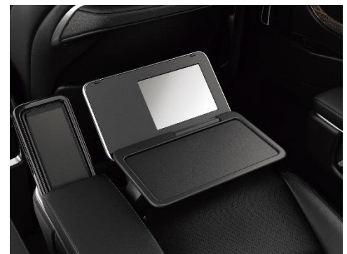
防汚コーティングを施したバニティーミラー