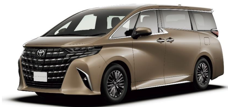
新型アルファード エグゼクティブブラウンジグレード

NSGグループでは、今後もCASEの急速な進展や環境貢献製品ニーズの高まりなどにより変革を続ける自動車分野において、そのニーズに対応した独創的な技術と高付加価値なガラスソリューションを提供して参ります。