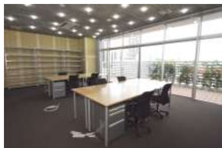
イノベーションオフィス (6 階)

KOIL パークや KOIL ファクトリーなど同フロアの 6 階には、短期間・小規模でレンタル可能な専有オフィスとなる「イノベーションオフィス」を 10 室用意。受付サービスや KOIL パークも無料で利用できます。4 階と 5 階のオフィスフロアは、約 75 坪から 1 フロア 800 坪超まで様々な企業規模に対応する賃貸オフィスです。ベンチャー企業の本社機能や、新規事業開発を進める大手企業の事業部門の入居ニーズに応えます。これらオフィスフロアと 6 階イノベーションフロアの利用者との交流をイベントや施設連携によって生み出すことで、多様な企業と個人とが出会い、刺激し合い、新産業を創造する拠点としていきます。