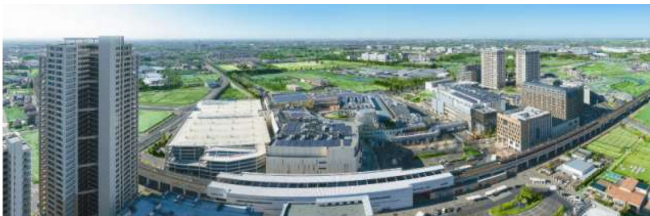
柏の葉スマートシティの空撮写真 (柏の葉キャンパス駅周辺 : 2014 年 2 月撮影)