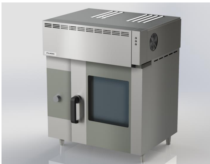
SCS-501AHR イメージ画像 ※4

※3 ホシザキ製電気式スチームコンベクションオープン A クラス【MIC-5TC3】当該1機種のみとなります。