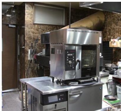
真上に換気設備がない場所での導入事例

要になります。また、既設の換気設備の限られた排気量をスチコンの蒸気回収のために割くことによる厨房全体の排気量不足も軽減します。換気設備の位置に左右されないため、スチコンを新規導入する際に厨房レイアウトの自由度が広がります。