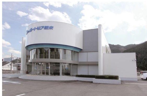
ミニボートピア朝来外観