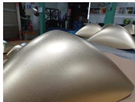
磨き上げられたシェード