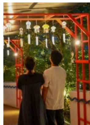
「くらげと風鈴」 ライトアップ