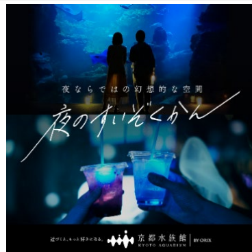
「夜のすいぞくかん」イメージ