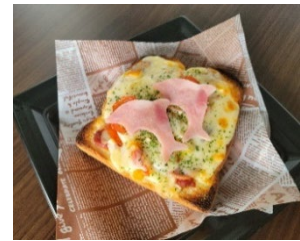
イルカピザトースト

販売期間：2023年7月15日（土）～10月2日（月） 販売場所：「ハーベストカフェ」 価 格：650円（税込み） ※「イルカピザトースト」の販売は午後2時以降となります。