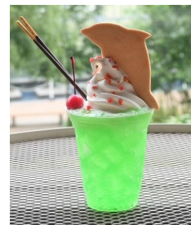
ドルフィンクリームソーダ

販売期間：2023年7月15日（土）～10月2日（月） 販売場所：「スタジアムカフェ」 価 格：680円（税込み）