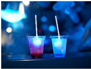
光る★クラゲソーダ （ソフトドリンク）