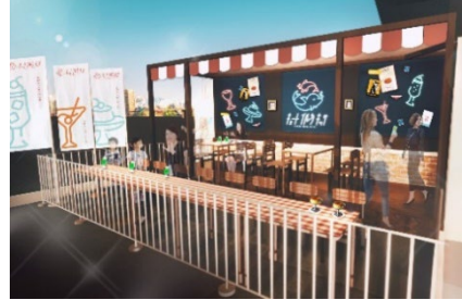
「キョート イルカ キッサ」 (イメージ)

「イルカスタジアム」の西側中段テラスに、レトロ喫茶をイメージした飲食スペース「キョート イルカ キッサ」が登場します。イルカのイラストやクリームソーダなどレトロな喫茶メニューをモチーフにしたネオンやのぼり、「イルカスタジアム」で泳ぐ5頭のイルカの紹介ポスターなどを展示。フォトスポットとしてレトロな空間をお楽しみいただけます。館内のカフェ「ハーベストカフェ」、「スタジアムカフェ」で販売する期間限定の喫茶メニューを持ち込み、プールを泳ぐイルカの姿をゆっくりとご覧いただけます。