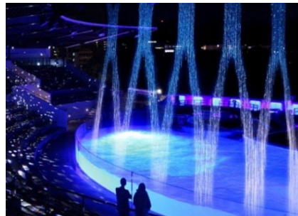
「ウォーターカーテン」上演イメージ (2016年撮影)

営業時間が午後8時までの「夜のすいぞくかん」開催日には、「イルカスタジアム」でウォーターカーテンと光と音を使用した幻想的な空間アートを上演します。午後7時～、7時30分～の1日2回の上演で、各回約5分間のプログラムです。