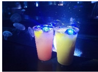
光る★クラゲカクテル （アルコール）