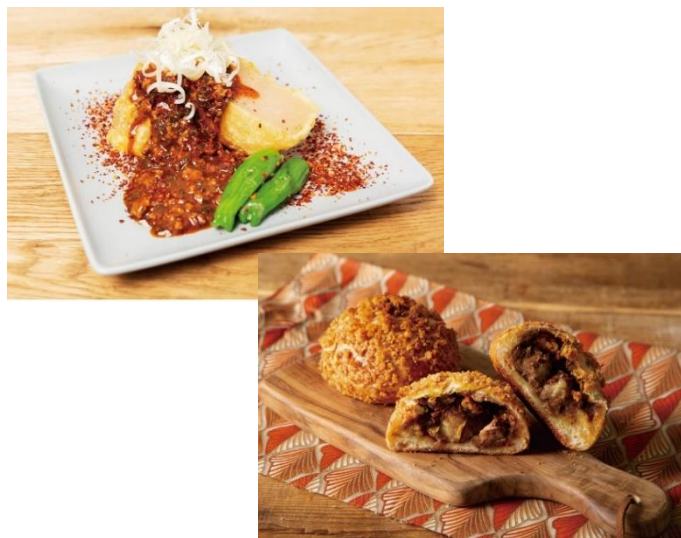
対象メニューイメージ（一部）