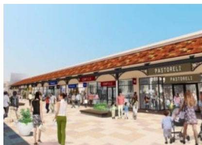
地中海リゾートをモチーフにした建物デザイン(第2期イメージ)