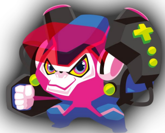
esports project公式マスコット キャラクター「イースラー」