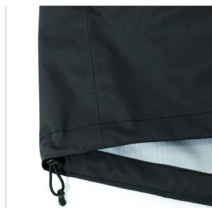
ウエストアジャスター