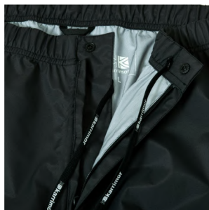
ウエスト調整コード& シャーリング仕様