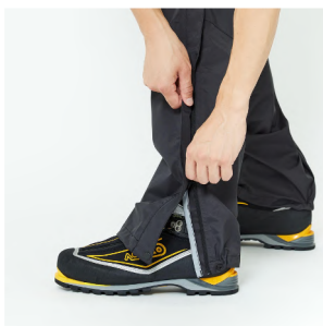
裾口アジャスターコード