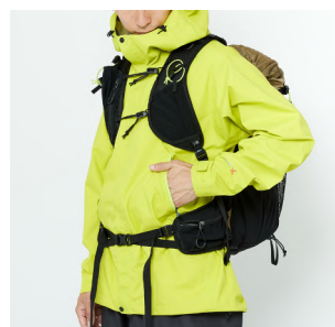
リュックサックとの相性を考慮したウエストポケット配置