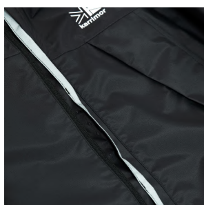
フロントジッパー雨返し