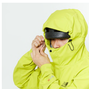
ヘルメット対応フード