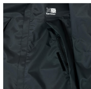
フラップ付きサイドジッパーポケット