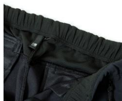
ウエストヨーク内側に吸水速乾素材採用