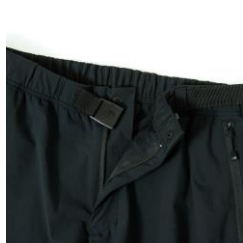
ウエストバックル仕様+フロントボタン