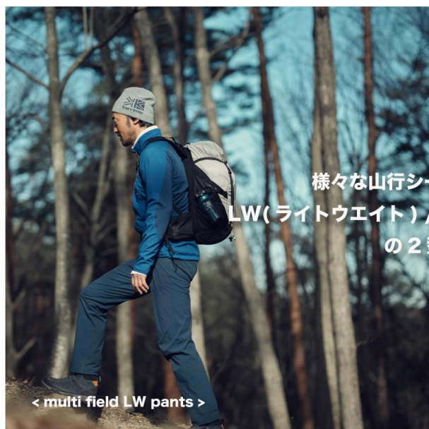
< multi field LW pants >