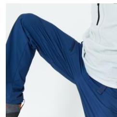
適度なストレッチ素材+足上げを考慮したパターンワーク