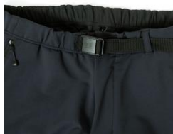
ウエストバックル仕様+フロントドットボタン