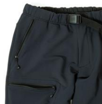
ジッパー付ポケット