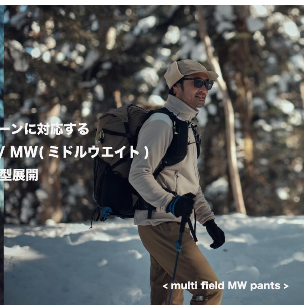
< multi field MW pants >

様々な山行シーンに対応する LW(ライトウエイト) / MW(ミドルウエイト) の2型展開