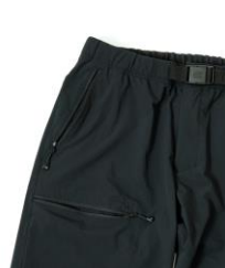
ジッパー付ポケット