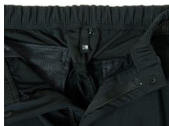
ウエストヨーク内側に吸水速乾素材採用