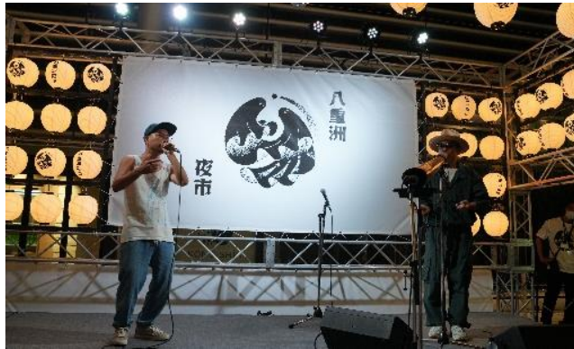
▲ステージの様子（8月10日時点）