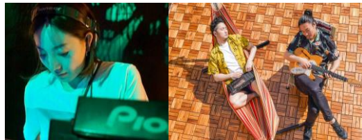
▲最終週出演予定アーティスト（一部）