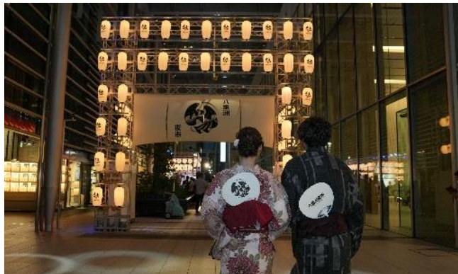
▲八重洲夜市入り口の様子（8月10日時点）