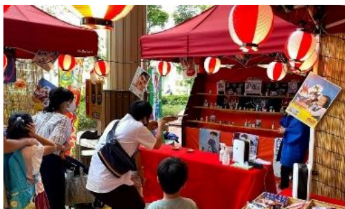
▲縁日屋台イメージ