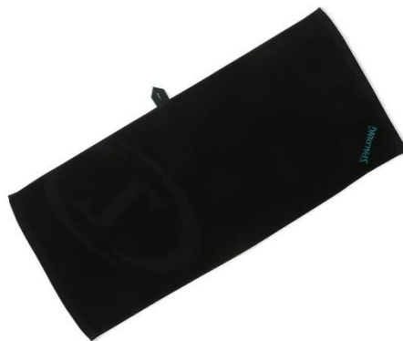
ブラック x フォレスト