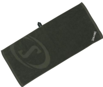
カーキ x ホワイト