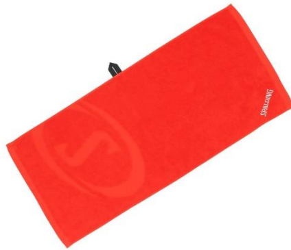
レッド x ホワイト