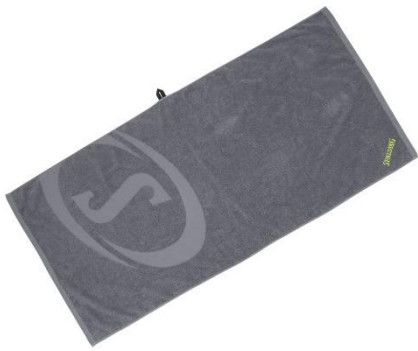
グレー x ライム