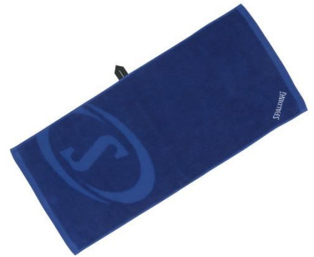
ブルー x グレー