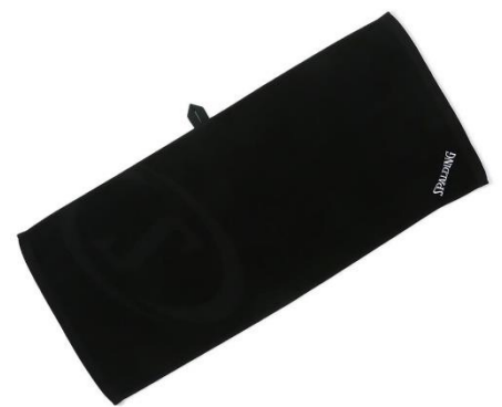
ブラック x ホワイト