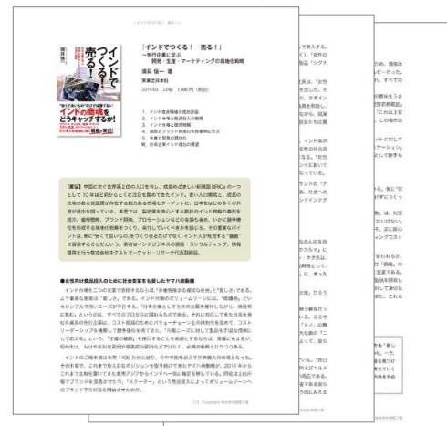
ダイジェストイメージ