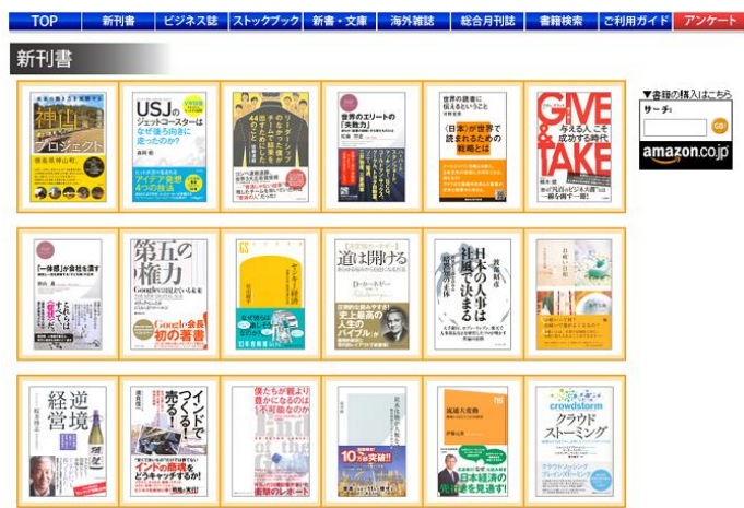
SERENDIP バックナンバーサイト

情報工場は、2005年の創業以来、創造力を育成する「きっかけ」として、週に1,000冊以上も出版される書籍の中から価値ある本を厳選配信するダイジェストサービス「SERENDIP」を提供し、知的好奇心のあるビジネスパーソンを中心に高い評価を得ています。また、企業の要望にあわせカスタマイズした教育用コンテンツや書籍の販促用ツールなどの編集企画サービスも提供しています。